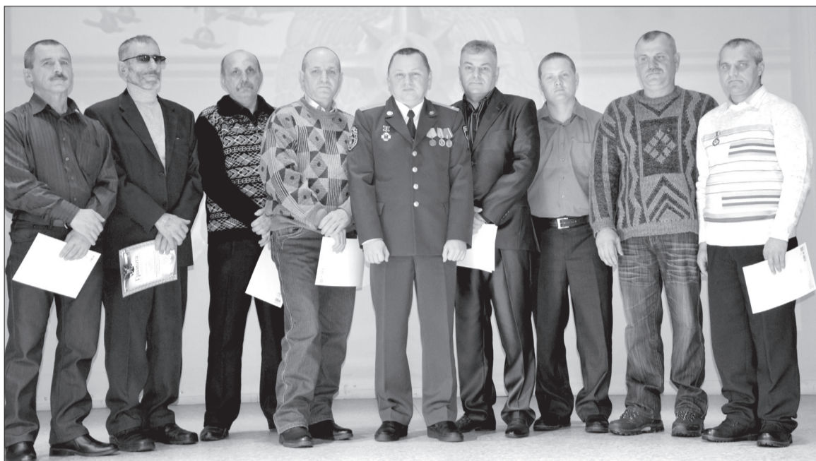
награжденные грамотами и благодарностями

Завтра в России отмечается День МЧС. По этому поводу накануне юбилея в зале ЦКД «Космос» собрались люди одной из самых отважных и самых необходимых профессий, те, кто первыми приходят на помощь в самых сложных жизненных ситуациях, люди, чья профессия - риск и мужество.