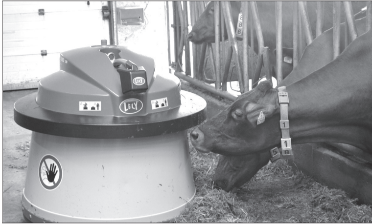
робот-кормоподгонщик за работой.

Научно-технический прогресс всё больше внедряется в сельское хозяйство, оно становится всё более механизированным, автоматизированным и роботизированным. На полях и фермах работают новая техника и агрегаты, применяются новые технологии. А на днях был сделан шаг внедрения в производство роботов. В одном из дворов нового животноводческого комплекса СПК «Белосток» появился необычный работник – робот-кормоподгонщик. Его задача подталкивать корма ближе к кормушкам, из кормового прохода после кормораздатчика. Он вполне успешно справляется со своими нехитрыми обязанностями. Это чудо-техники голландского производства. По размерам он небольшой: в высоту 60 сантиметров, в диаметре – 1,1 метра. Стоимость