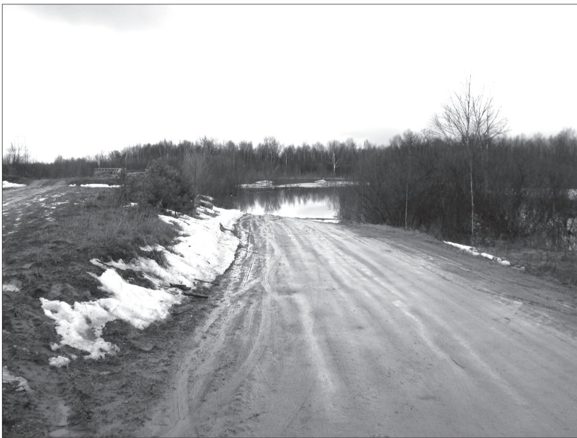
Дорога через Апталач. Воскресный скачок уровня воды в Оби сказался на транспортной доступности нескольких населенных пунктов района.

Паводок в Красноярском сельском поселении проходит спокойно: подтопленей жилых домов нет, дороги в населенном пункте не перелиты.