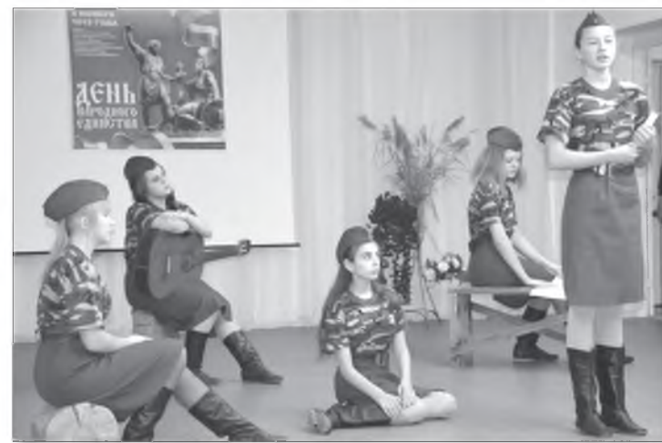
коллектив «Зеркало» - победитель областного конкурса

Десять лет назад в календаре российских праздников появился еще один – День единства народов России. История его уходит корнями к 17-му веку, дате освобождения Москвы силами народного ополчения под руководством Кузьмы Минина и Дмитрия Пожарского от польских интервентов в 1612 году. И вот уже на протяжении десятка лет россияне отмечают эту дату.